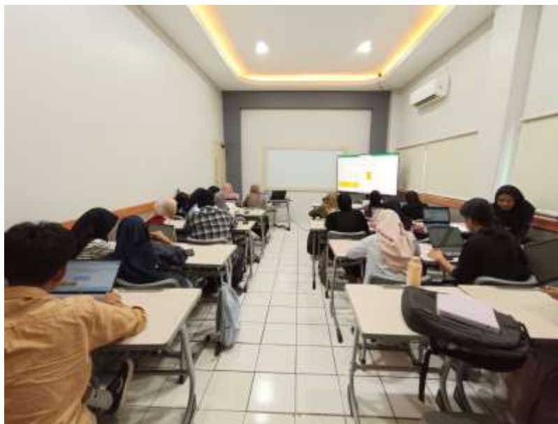
Gambar 2. Kegiatan Pelatihan Pengolahan Data

Materi fungsi teks juga memberikan manfaat nyata bagi peserta, terutama dalam mengolah data impor dari alat ukur atau file eksternal yang seringkali tidak rapi. Peserta belajar menggunakan LEFT, RIGHT, MID, TRIM, dan CONCAT untuk memperbaiki struktur teks sebelum dianalisis lebih lanjut. Hal ini menjadi bekal penting karena banyak data ilmiah tidak selalu langsung dalam format numerik.